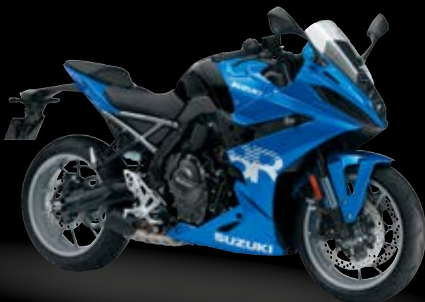
YSF: Metallic Triton Blue