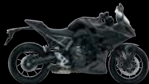
YKV: Metallic Mat Black No.2