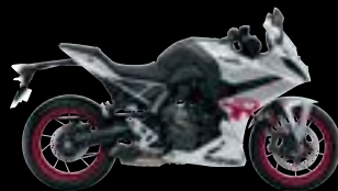
QKA: Metallic Mat Sword Silver